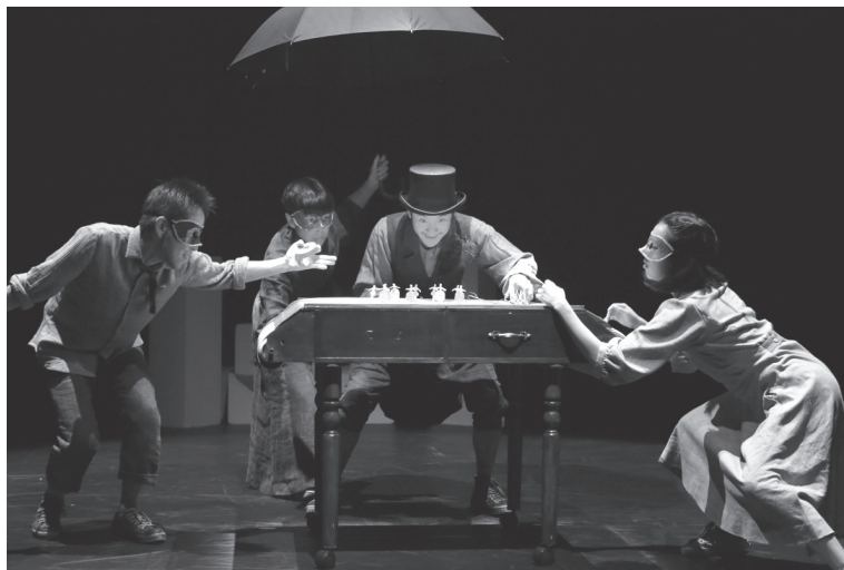
2016年穂の国とよはし芸術劇場